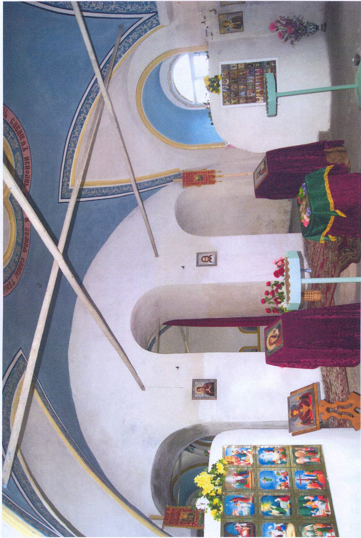
Фото 5. «Сласская церковь, 1776 г.», Кировская область, Кирово-Челецкий район, с. Вяз.