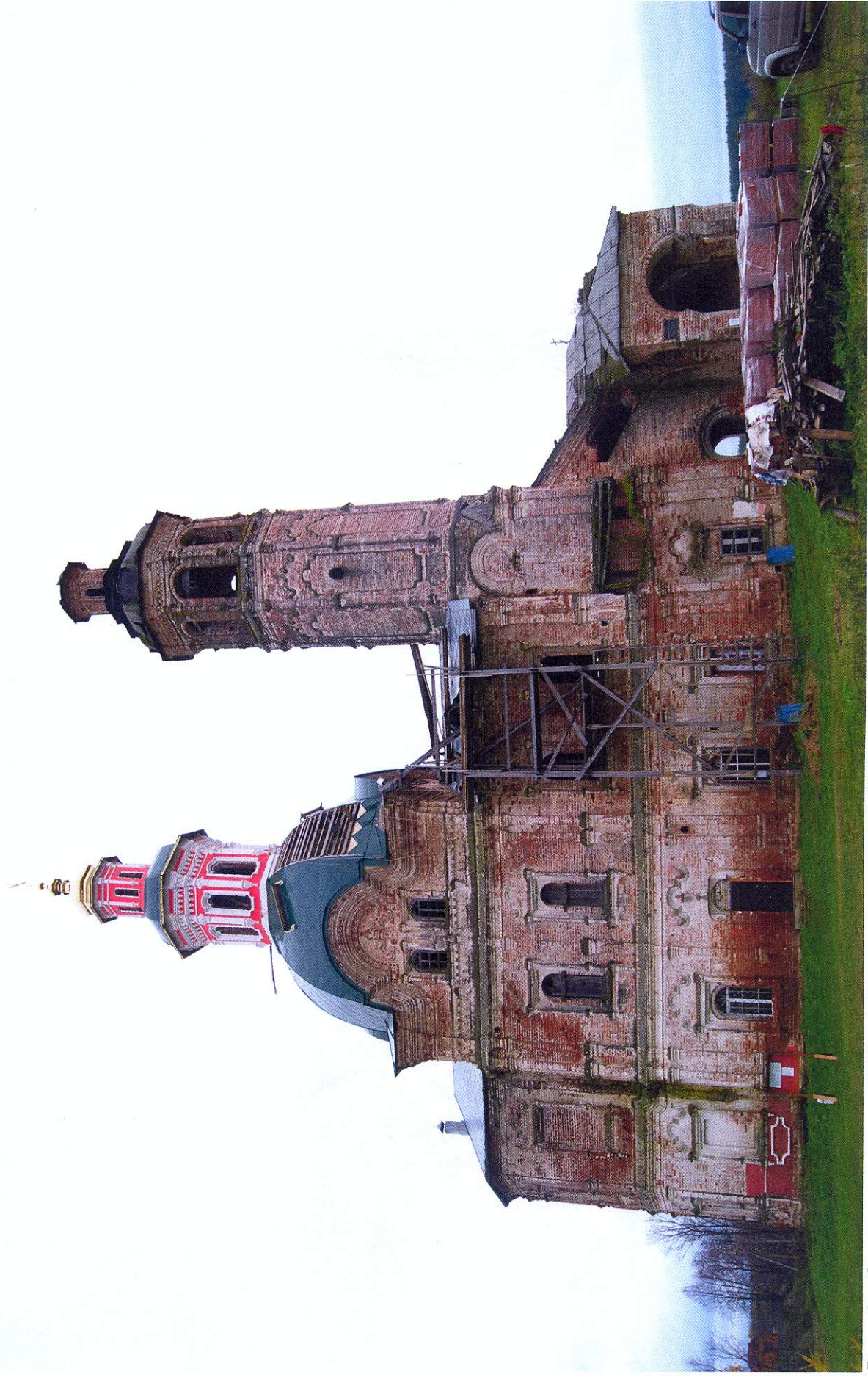
Фото 1. «Спасская церковь, 1776 г.», Кировская область, Кирово-Чепецкий район, с. Вяз.