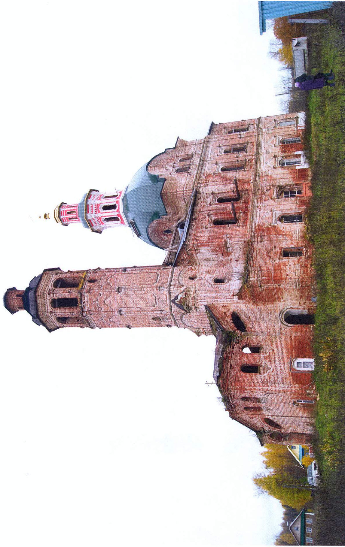
Фото 4. «Спасская церковь, 1776 г.», Кировская область, Кирово-Чепецкий район, с. Вяз.