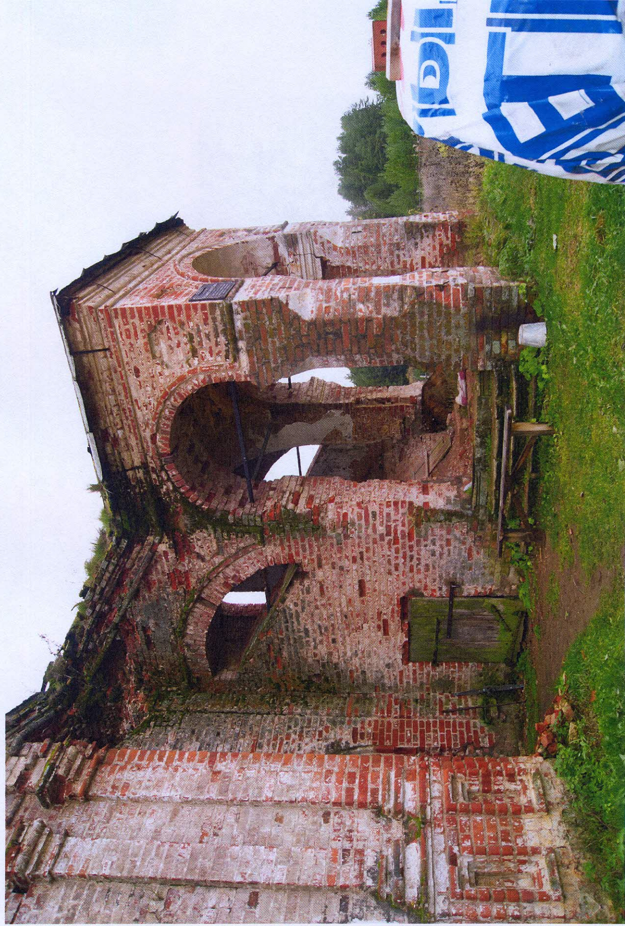
Фото 3. «Спасская церковь, 1776 г.», Кировская область, Кирово-Челецкий район, с. Вяз. 07.10.2013.