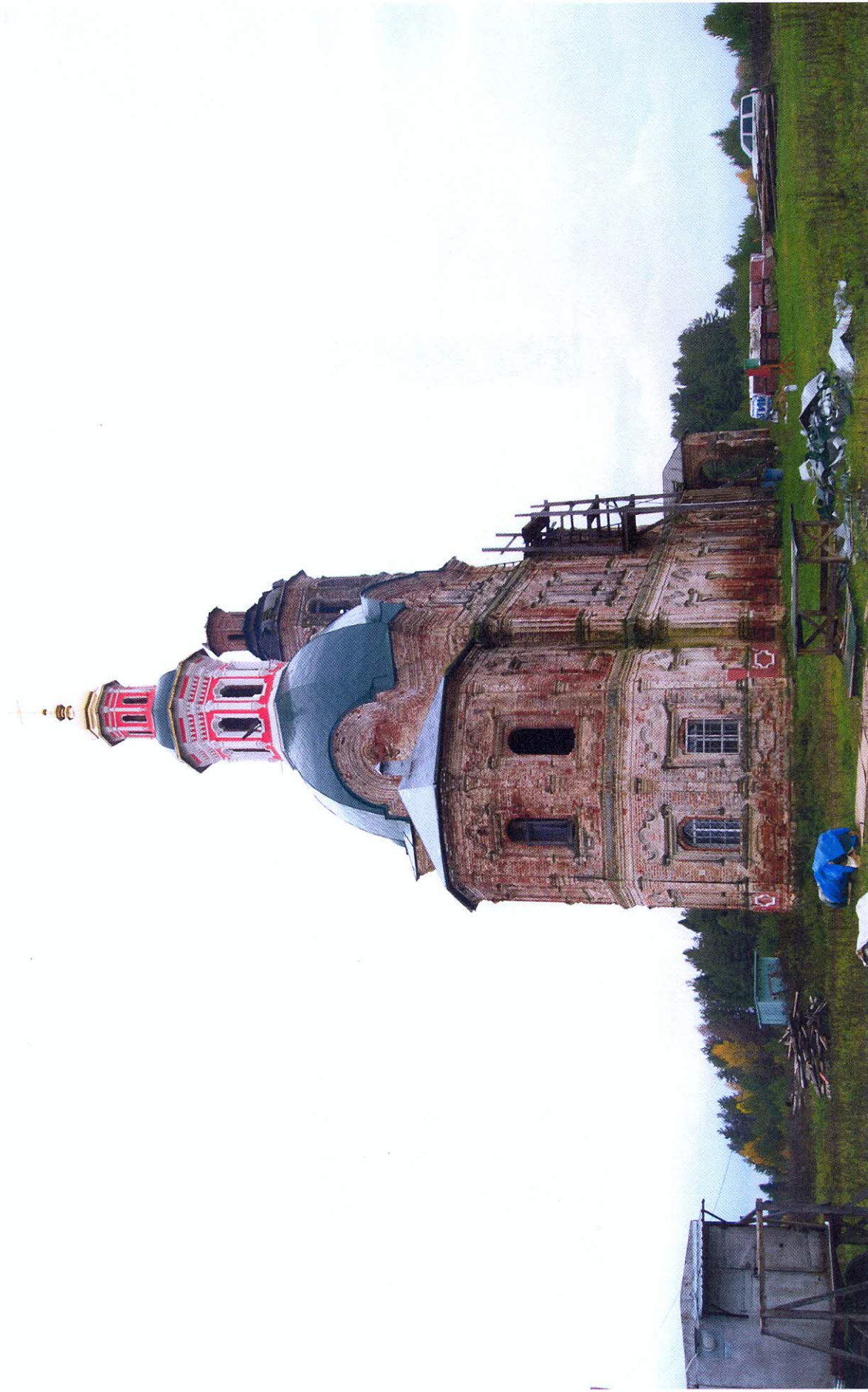
Фото 2. «Спасская церковь, 1776 г.», Кировская область, Кирово-Челецкий район, с. Вяз.