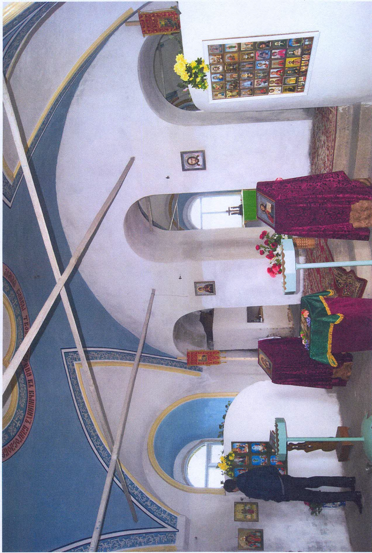
Фото 6. «Спасская церковь, 1776 г.», Кировская область, Кирово-Чепецкий район, с. Вяз. 07.10.2013.